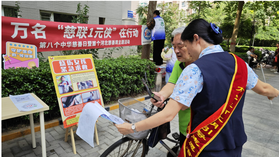
第八个中华慈善日开展线下劝募活动

益等平台发起的，如“520 小红花日”、“95 中华慈善日”、“99 公益日”等活动，通过联动省内各高校、社区和企业参与当中，提高公众人人公益的意识，所筹善款全部用于大病患者的治疗费用及生活费用。