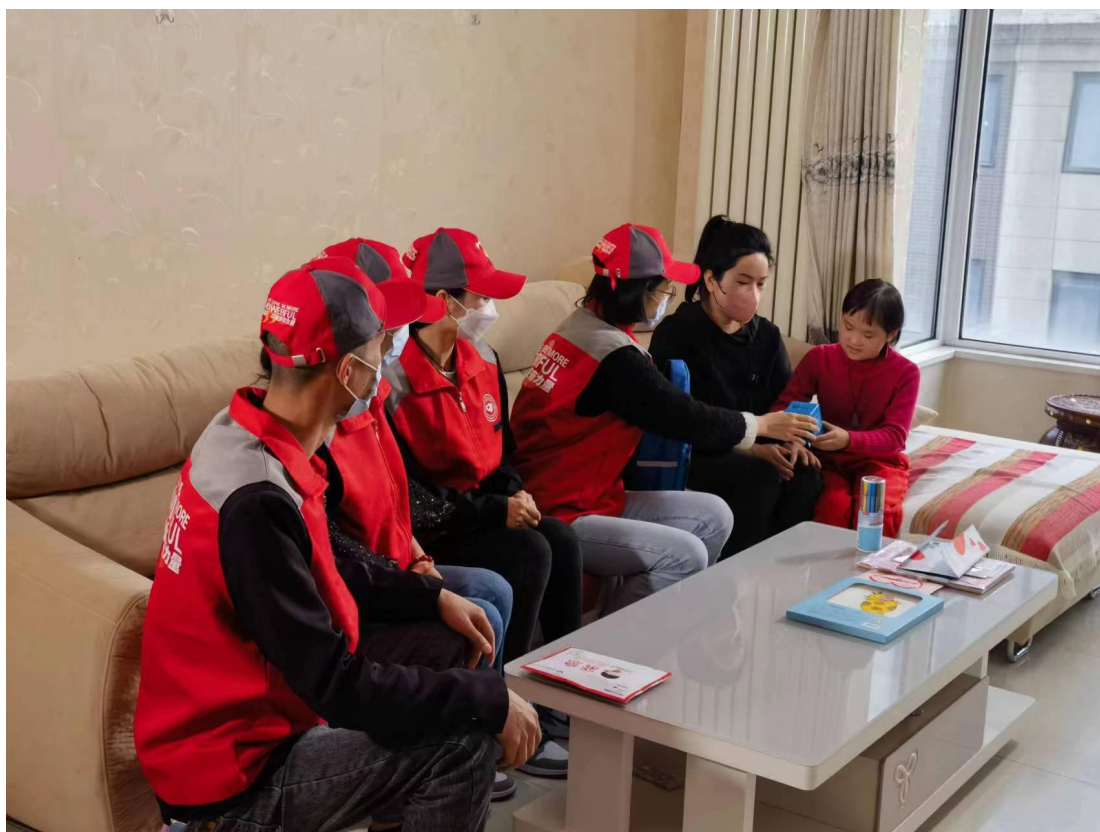
志愿者为小珍妮送去紧急救助金

2023 年 4 月，我会项目组前往 4 名儿童受助人家中实地走访慰问，为他们送去了 40000 元生命急救金。同时，通过河北广播电视台的报道，呼吁更多的爱心人士关注这些身患重病的孩子。