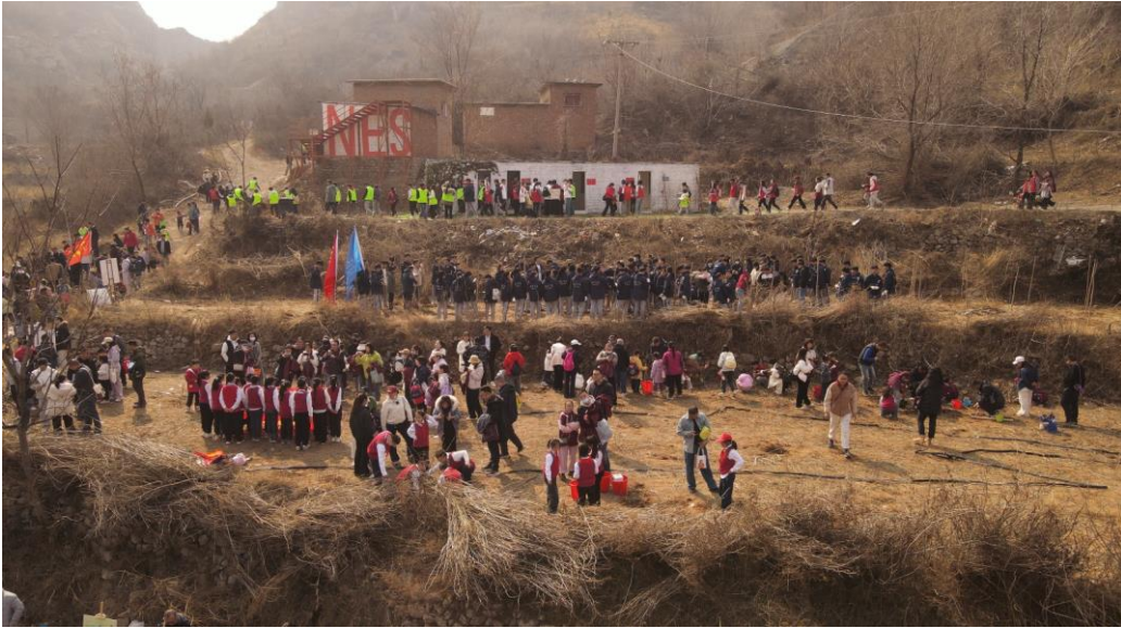
(2025年万人植树活动现场)