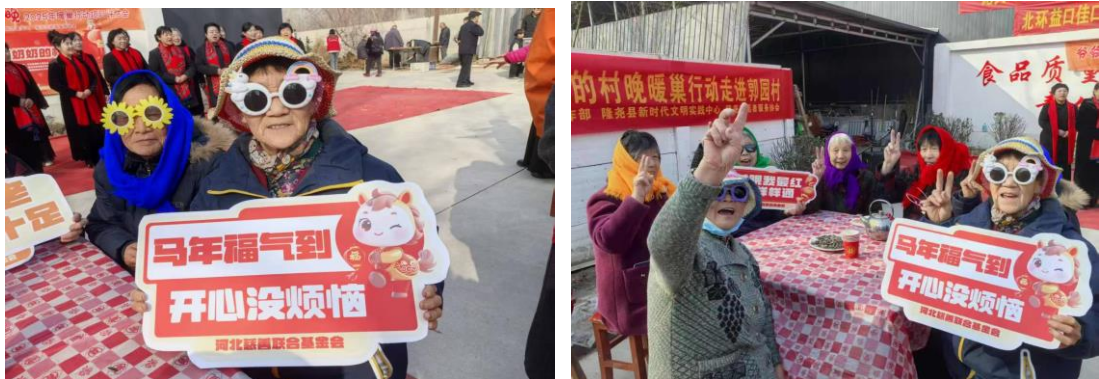
（“村晚”活动现场老人们开心的合影）