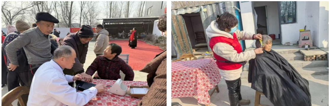
（“村晚”活动现场义诊、义剪环节同步开展）