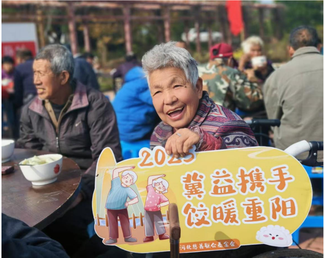
（在邢台西羊卧村开展饺子宴惠及百名老人）