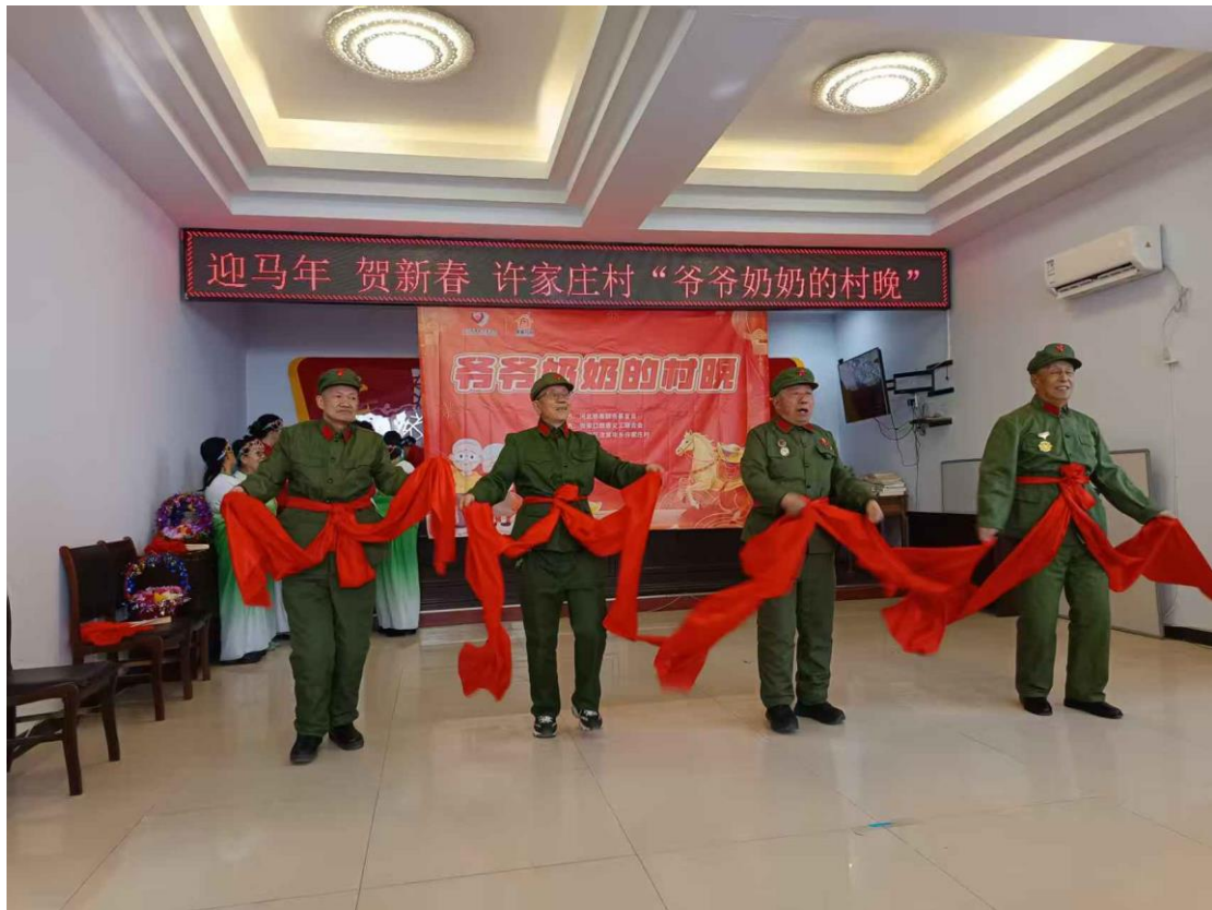
(张家口地区的老人在村晚活动上展示才艺)