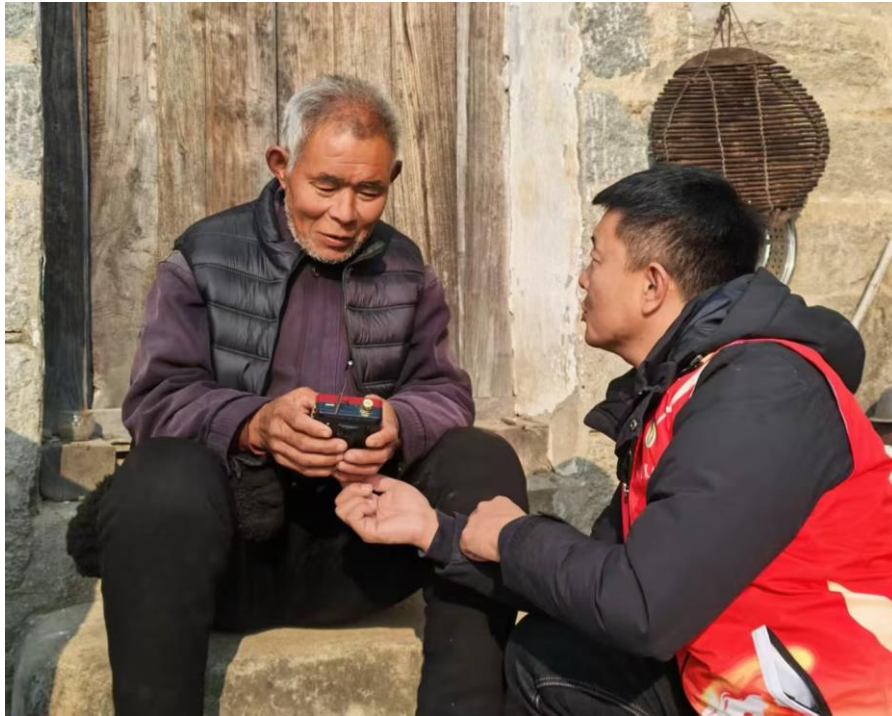
（为邢台地区空巢老人发放暖巢礼包）

带来了便利与舒适，让他们的生活更加贴心。2025 年度，暖巢行动项目组已走过石家庄市、邯郸市、承德市、张家口市等地市，为 9000 余名空巢老人送去暖巢礼包。