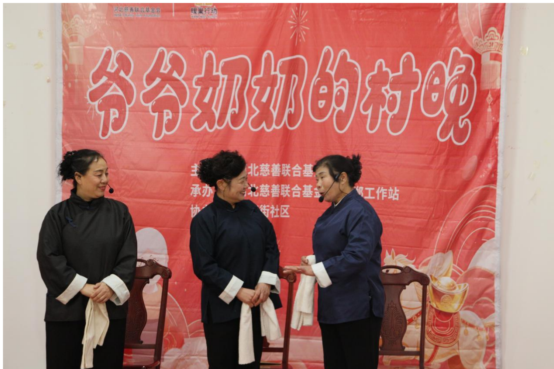
(邯郸地区的老人在“村晚”活动上表演节目)