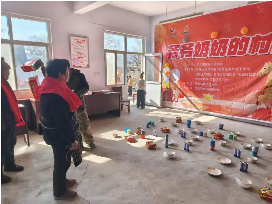
（邢台地区的老人参与“村晚”活动的趣味套圈游戏）