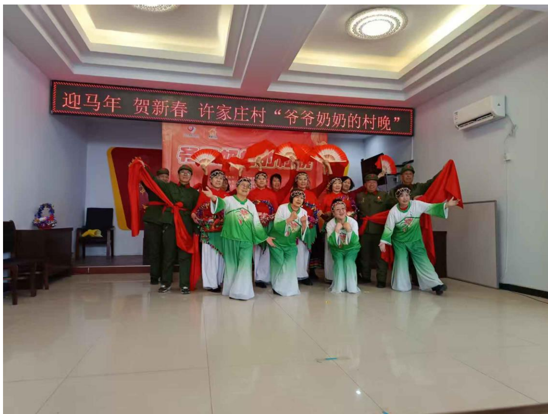
（张家口地区的老人在“村晚”活动上展示才艺）

不同于城市春晚的华丽璀璨，这场村晚没有专业演员和精致舞台，却满是真诚与烟火气。所有节目由老人们自编自导自演，用淳朴演绎诉说乡村故事、表达生活热爱，成为专属老人们的新春盛会。